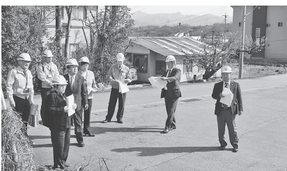
▲大工区耐震性貯水槽設置工事予定箇所の視察の様子

○要望事項として、議案第18号関係付託部分に関連し、機構改革に伴う新年度の組織改編については、組織の統廃合による体制のスリム化を本来図るべきであるが、今回の機構改革では、新たに三統括監の配置を予定している。3人の統括監が本市にとって必要であるのか、疑問視される。については、統括監の職務と方向性について、今後1年間の実務における評価とあわせ、組織体制と給与体系を再考する必要がある。