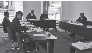
▲教育民生常任委員会での審査の様子

現在、市民の皆様へ市体育施設に関するアンケート調査を行っていると思うが、その結果をどのようにか反映させるのか伺いたい。