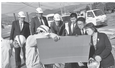
▲小原東東後屋敷線道路改良箇所の視察の様子

現地視察として、小原東東後屋敷線道路改良箇所及び南反保地域整備推進事業箇所の視察を行った。