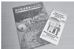
▲森林経営管理法パンフレット