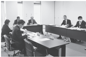
▲建設経済常任委員会での審査の様子

答 道路改良工事では、道路と路床の強さを調査する。その結果、小原東東後屋敷線は元々が畑であったため、路床の補強が必要となり、当初は、セメントを現場の土に混ぜる補強方法を考えていた。しかし、セメントを混ぜて土を補強すると、道路完成後に下水道管等を敷設することになった場合掘削された土は産業廃棄物と