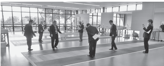
▲山梨市民総合体育館の視察の様子

現地視察として、加納岩保育園の新園舎、山梨市民総合体育館、山梨市老人健康福祉センター及び、山梨市デイサービスセンターの視察を行った。