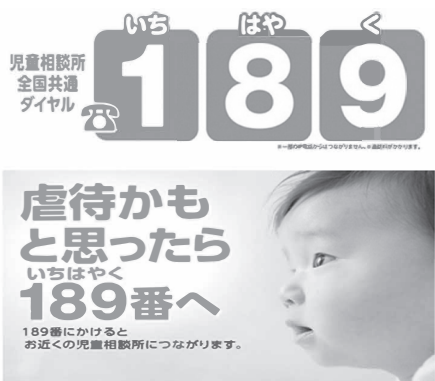
▲緊急通報ダイヤル189（いちはやく）

○児童虐待防止の現状と緊急通報ダイヤル「189（いちはやく）」の周知徹底について○新元号に対応したスムーズな行政運営について○下水道事業について