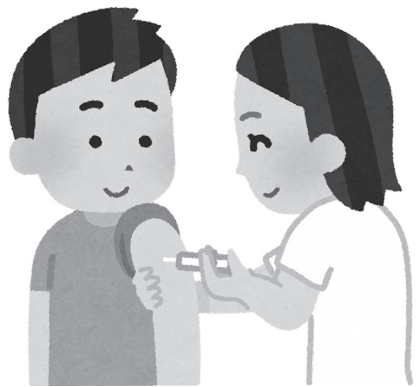
▲メディカル予防注射

①平成31年度については、 抗体検査と予防接種を公費助 成で受けるためのクーポン券を昭