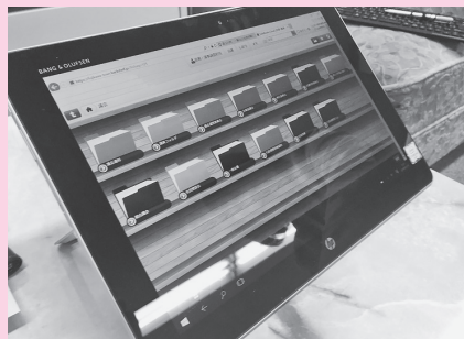
▲富士川町議会で使用されている端末とアプリケーションソフト

2月には、県内においていち早く議会へのタブレット端末導入に踏み切った、富士川町議会の視察研修を行い、完全ペーパーレス化と議会活動の活性化・効率化を目指した取り組み事例を学びました。これまでの膨大な紙資料を必要としてきた議会と比較し、タブレット端末を使用し、ペーパーレス化を図ることで、議案をはじめ予算・決算書、