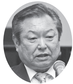
村田 浩 議員