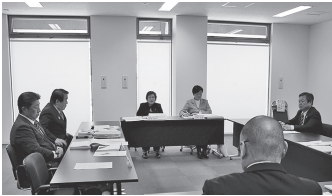
▲総務常任委員会での審査の様子

答 防災・減災に対する市民の意識の高揚が図られる取り組みと、自助・共助を見据えた自主防災組