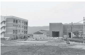
▲駅舎及び駅南地域整備状況

○本市のゴミの回収・処理について○期日前投票所の増設について○市民総合体育館軽スポーツ広場整備事業とスポーツ施設の広域化について