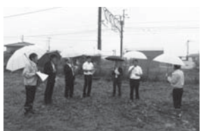
▲建設経済常任委員会視察