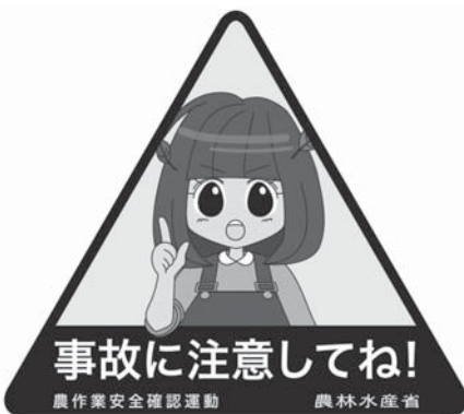
▲農作業安全確認運動