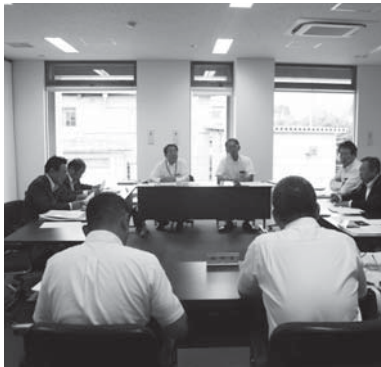
▲総務常任委員会での審査の様子

答 近年の国保加入者の医療費は一人当たり、平成25年度32万7千円余、平成26年度33万9千円余、後期高齢者医療制度加入者の医療費は一人当たり、平成25年度87万3千円余、平成26年度90万1千円余となっており、万円単位