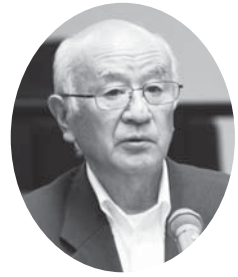
雨宮 巧 議員