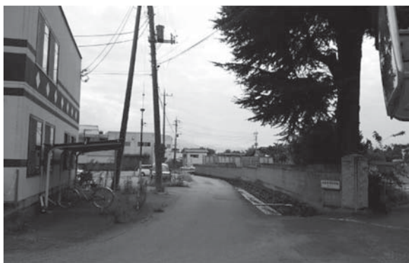
▲加納岩小学校西通り線予定地