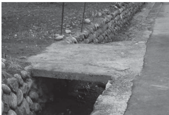
▲法定外公共物の構造物

●SROI(社会的投資収益率)導入について ●強固な地盤を活用した定住促進について