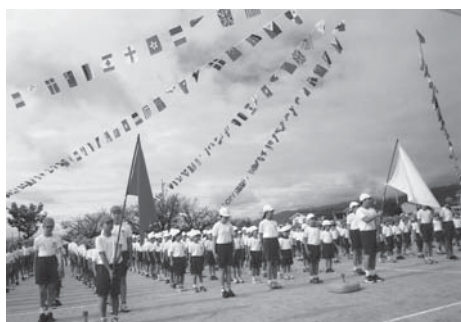
▲日下部小学校の運動会

●地球温暖化防止策について ●すべての国保加入者に正規保険証の交付を ●上水道の諸費用の個人負担について