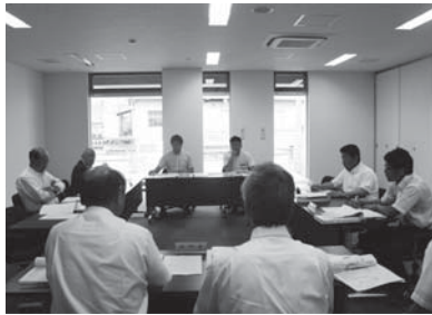
▲建設経済常任委員会での審査の様子

答 事前に債務負担行為を取ら なければJR東日本と協定を 結ぶことができず、事業のスケ ジュールから逆算すると、議決後 すぐにも協定を結ぶ必要がある。 また、協定の範囲については、線路 直近の橋脚2か所および2径間であ る。