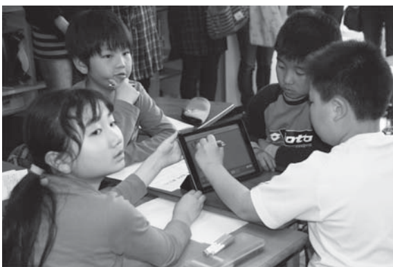
▲タブレットを使用した授業風景

答 新図書館は人と人、子供と本など幅広く「つながりの生まれる図書館」をコンセプトに運営していく。児童スペースやインターネット環境の充実を図り、新たに整備した多目的室を利用した展示会、ミニ講演会等を企画し、人が集まり交流できる図書館を目指す。また、職員のスキルアップや図書館ボランティアとの協働により気持ちよく過ごせる雰囲気づくりに努め、多くの市民の皆様にご利用していただける図書館にしたいと考えている。