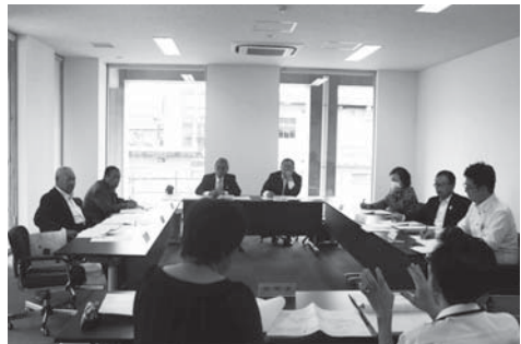
▲教育民生常任委員会での審査の様子

答 山梨市民会館及び市立図書館は、既に8月末で工事は終了している。現在、市民会館は、備品の搬入を進めている状況であり、図書館は、改修前に搬出した図書を搬入し、配架している状況である。