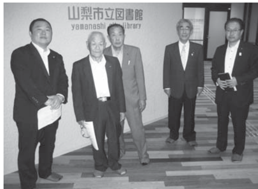
▲市立図書館の視察

答 介護サービスを利用する方は年々増えており、運営状況は、基金から支出するなど、毎年厳しい状況下にある。平成30年度からは、第7期介護保険事業計画を予定しているが、その中で介護保険料についても検討していく必要がある。