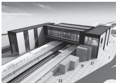
▲山梨市駅南北自由通路

答 広報やまなしやテレビ・新聞など、さまざまな媒体を利用して市民に情報を開示し、登録に向けた機運の醸成に努めている。地域課題についても、自然の保存や有効活用、過疎・高齢化問題への対応や、シカの食害対策についても対応していきたい。本年10月に申請書を提出し、平成30年の登録を目指すし、県・関係市町村とともに、検討を重ねたいと考える。